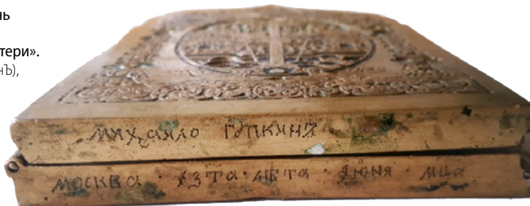
Рис. 22 Подписной и датированный четырёхстворчатый складень «Двадцатые праздники. Поклонение иконам Богоматери». Мастер Михайло Губкин (Гупкинъ), г. Москва, ЗТА г. нижние торцы 2 и 3 створ.