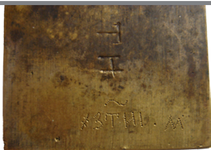
Рис. 8 Оборот той же иконы. в нижней части на одной линии чеканом выбиты дата «#3ТИИ», правее «точка» и еще правее буква «М». На обороте иконы в средней части выбиты буквы «ТН» (владельческие пометы). Собрание С.А. Альперовича, Москва. Фото автора в 2012 г.

Рис. 7 Икона «Богоматерь Одигитрия Смоленская» (лицевая сторона). Медный сплав, литые. Размер: 6,05 x 5,4 см.