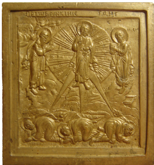
Рис. 1 Икона Преображение Господне (лицевая сторона) медный сплав, литье. размер 5,7 x 5,3 см. клейма «ЗТБ» и «МГ» по нижним углам оборота. Собрание С.А.Альперовича