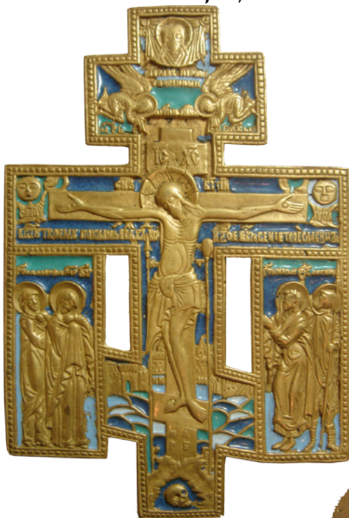
Рис. 9 Крест киотный «Распятие Христово с предстоящими» (лицевая сторона). Медный сплав, литье, эмаль (белая, голубая, синяя, бирюзово-зеленая). Размер: 17,0 x 11,35 см.