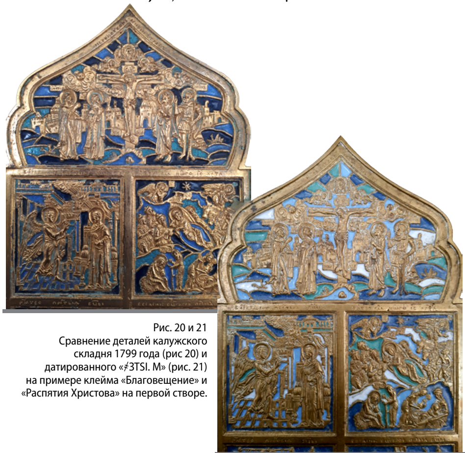
Рис. 20 и 21 Сравнение деталей калужского складня 1799 года (рис 20) и датированного «ЗТСИ. М» (рис. 21) на примере клейма «Благовещение» и «Распятия Христова» на первой створе.