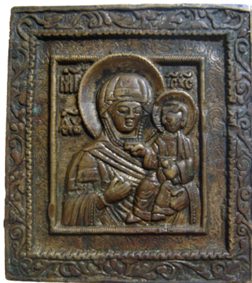
Рис. 7 Икона «Богоматерь Одигитрия Смоленская» (лицевая сторона). Медный сплав, литые. Размер: 6,05 x 5,4 см.

Рис. 8 Оборот той же иконы. в нижней части на одной линии чеканом выбиты дата «#3ТИИ», правее «точка» и еще правее буква «М». На обороте иконы в средней части выбиты буквы «ТН» (владельческие пометы). Собрание С.А. Альперовича, Москва.