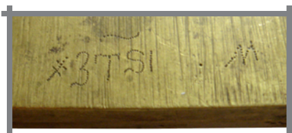
Рис. 12 Оборот 3-й створы того же складня с датой. Собрание С.А.Альперовича.